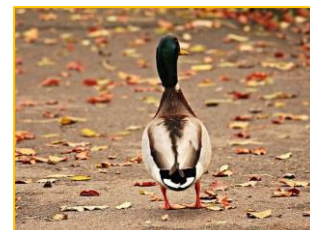
Hvor er vi på vej hen

Årsfest. Program følger Arr.: Udvalget for årsfest og sæsonafslutning